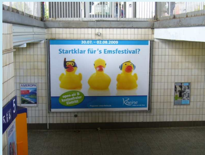
Beispiel Bahnhof Rheine Am Ausgang zum Bahnsteig