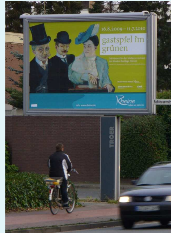
Beispiel Rheine Konrad-Adenauer-Ring