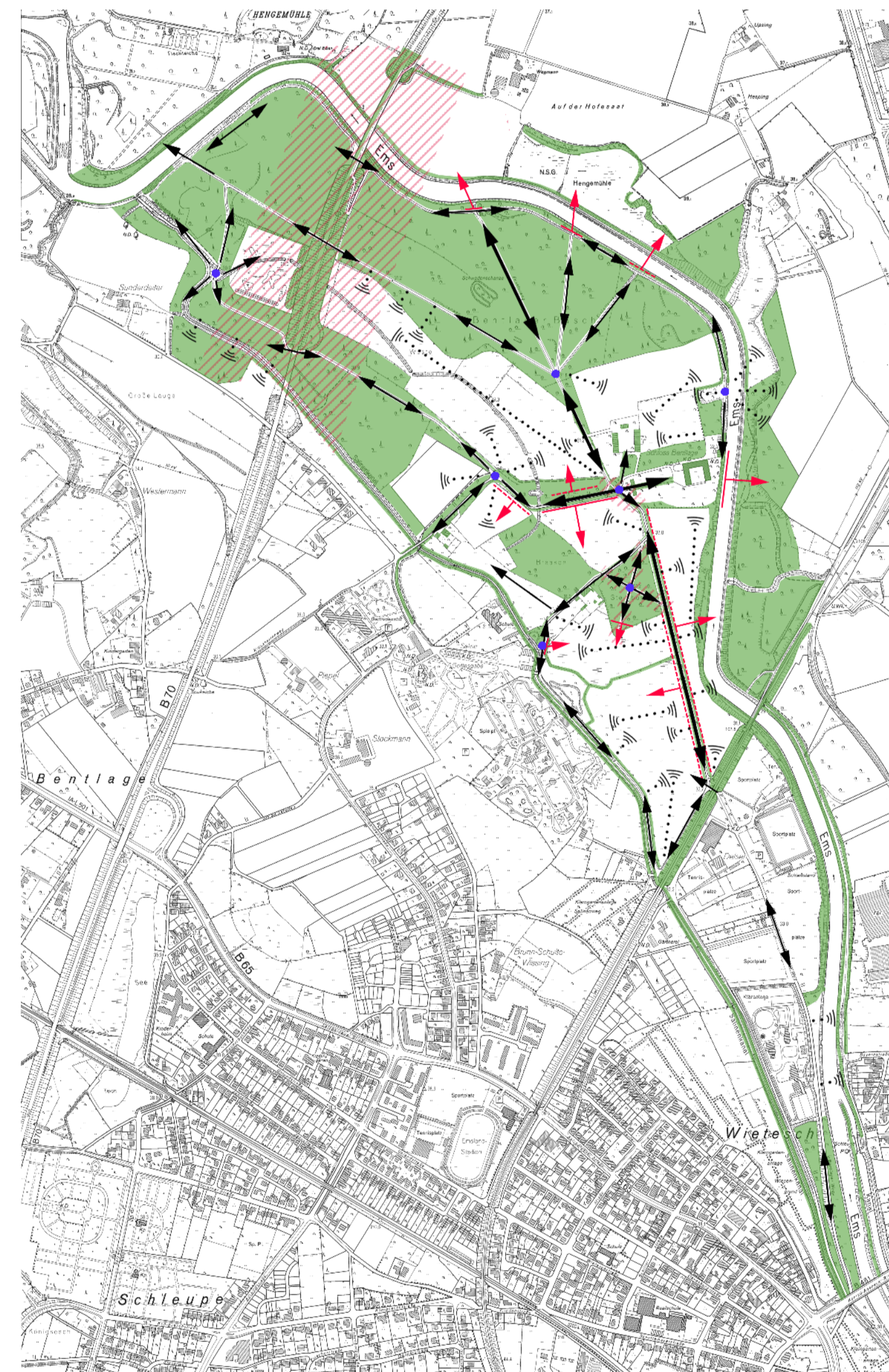
Landschaftsbild - Potenziale und Defizite