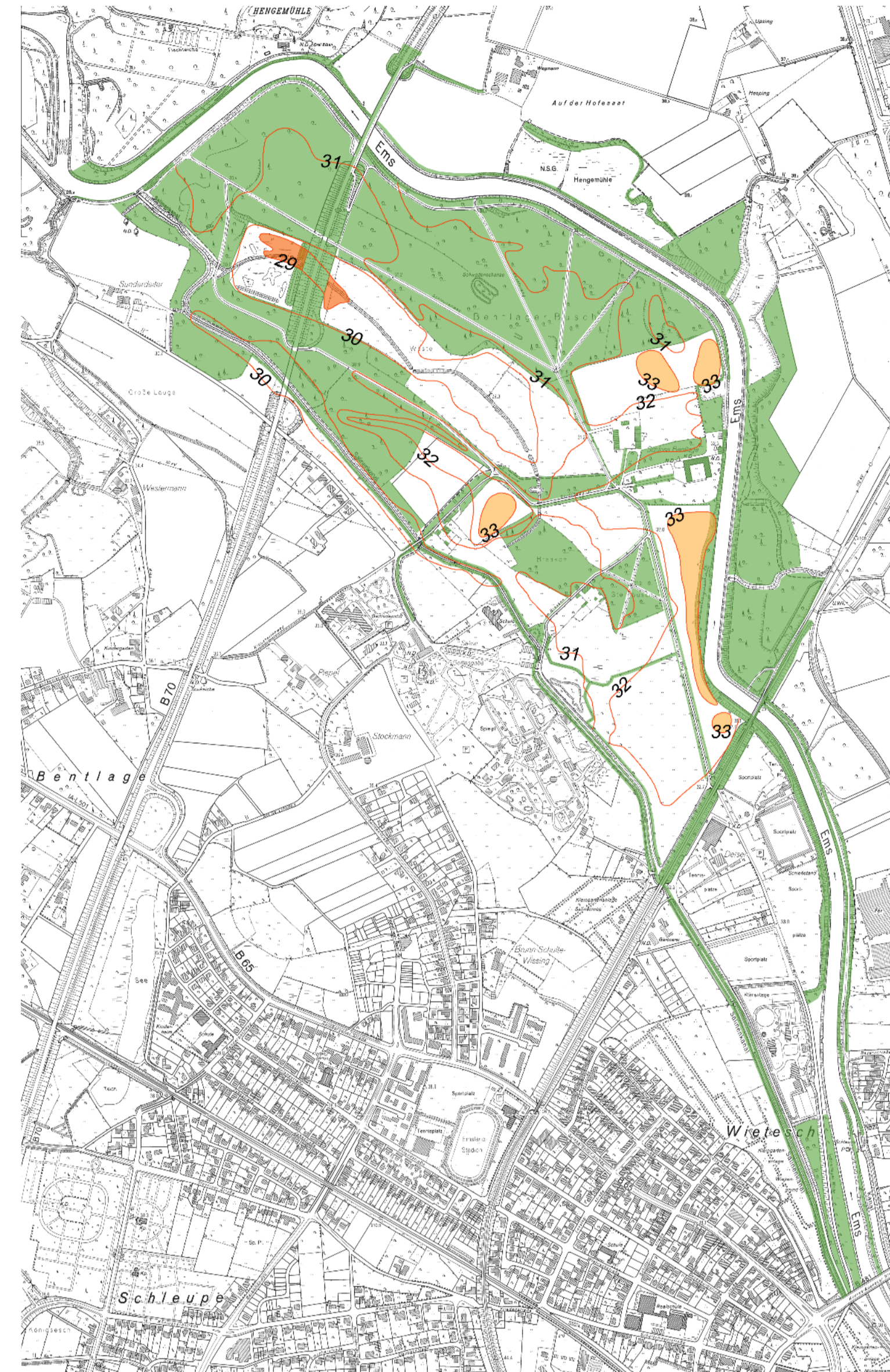
Landschaftsbild - Topographie und Raumkanten