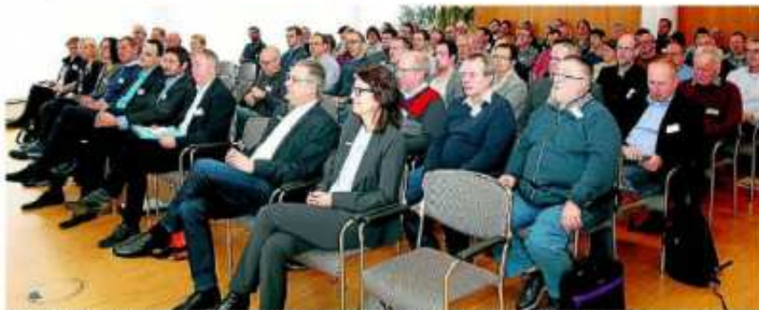
Vertreter zahlreicher Sportvereine sowie von Schulen, aus Politik und Verwaltung nahmen an der ersten Fachkonferenz teil.

In den Dialogforen gab es einen regen Austausch und Diskussionen. Rund 40 Interessenten nahmen am Forum zur „Kooperation“ teil. „Gerade aus dem stärksten Forum konnten viele wertvolle Anregungen und Hinweise für die Umsetzung gewonnen werden“, zog Schridde eine positive Bilanz der ersten Fachkonferenz dieser Art in Rheine. Er glaubt: „Es ist erkannt worden, dass man zukünftig mit kreativen Kooperationen und Abstimmungen innerhalb und außerhalb der Verwaltung Sport und Bewegung in Rheine modern und bedarfsgerecht aufstellen kann.“