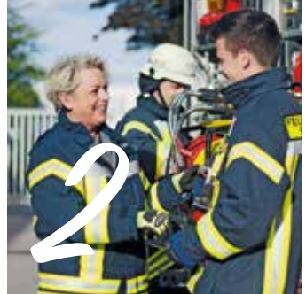
2 UNFALL- VERSICHERUNG Seite 10