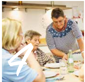
4 WEITERE VERSICHERUNGEN Seite 28