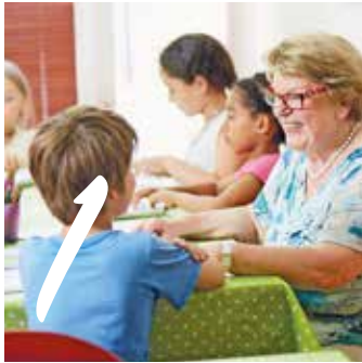
1 VERSICHERUNGSSCHUTZ IM EHRENAMT Seite 4