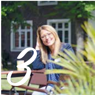
3 HAFTPFLICHT- VERSICHERUNG Seite 20