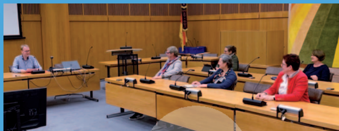
Sitzung des Familienbeirats im Rathaus

Der Familienbeirat trifft sich regelmässig und bespricht aktuelle Projekte oder plant weitere Maßnahmen.